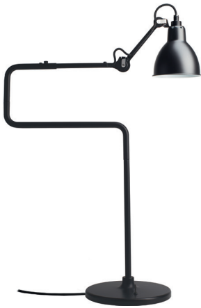
Table lamp | Lampe de table